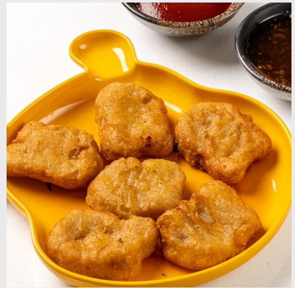
นักร้องไก่ CHICKEN NUGGETS