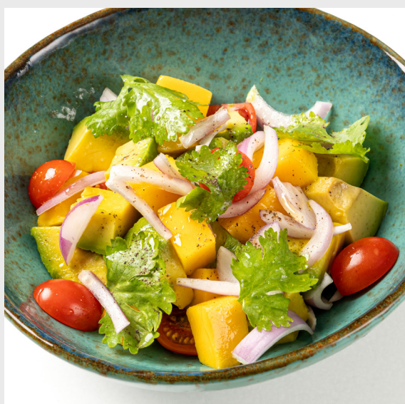
อโวคาโด และมะม่วงสลัด AVOCADO & MANGO SALAD 🌿