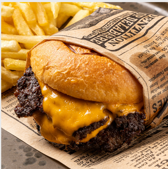
สแมชชีสเบอร์เกอร์เนื้อ SMASH WAGYU BEEF CHEESEBURGER