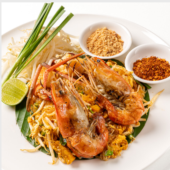
ผัดไทยวุ้นเส้นไก่/กุ้ง PAD THAI VERMICELLI Chicken/Shrimp (Contains nuts)