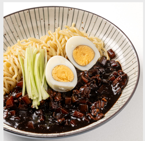
จajangmyeonไก่/หมู/เนื้อ/ทะเล JAJANGMYEON (KOREAN) Chicken/Pork/Beef/Seafood