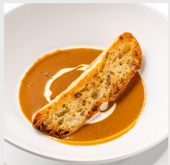
ซูปชั้นล็อบสเตอร์ บิสค์ LOBSTER BISQUE