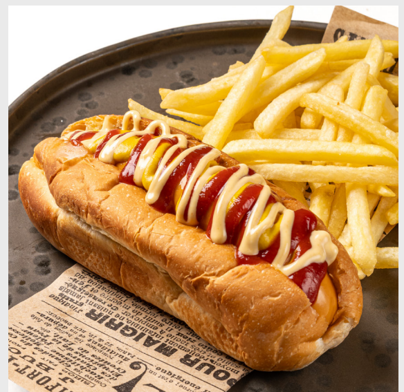
ออริจินัลฮอตดอก ORIGINAL AMERICAN HOTDOG 🐷