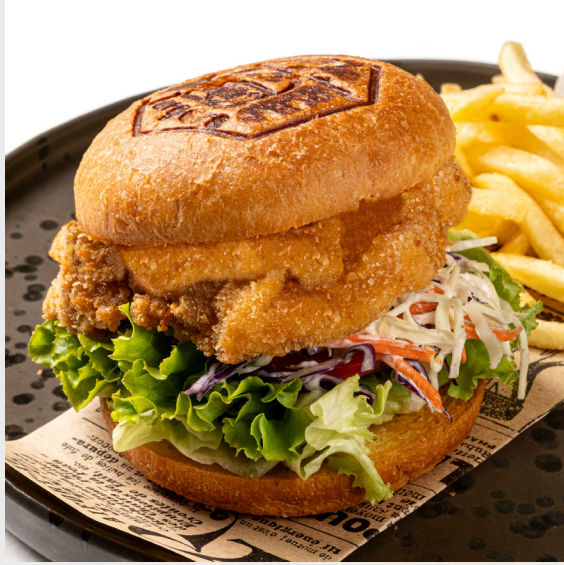
เบอร์เกอร์ไก่กรอบ CRISPY CHICKEN BURGER