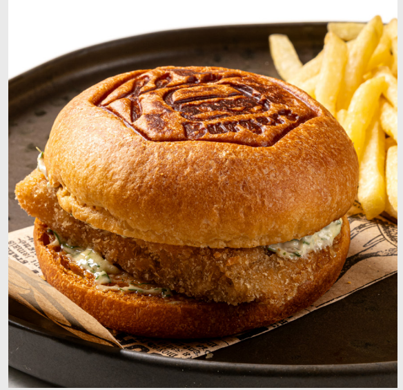
เบอร์เกอร์ปลา FISH BURGER