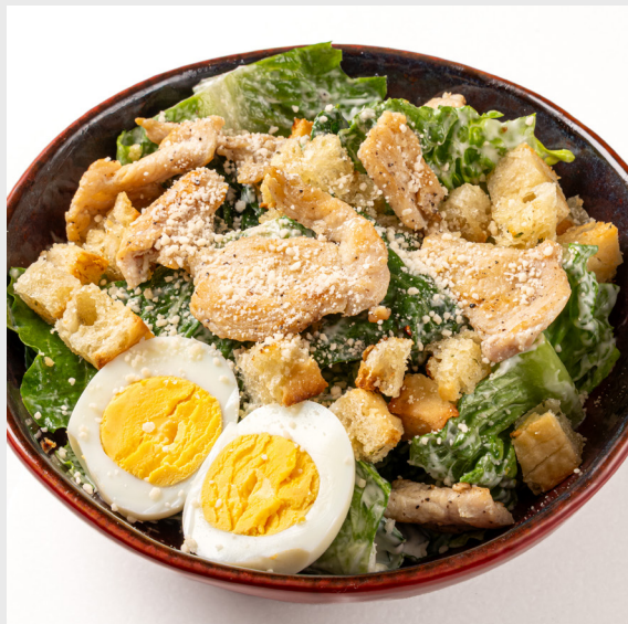
ซีซาร์สลัดไก่ CHICKEN CAESAR SALAD