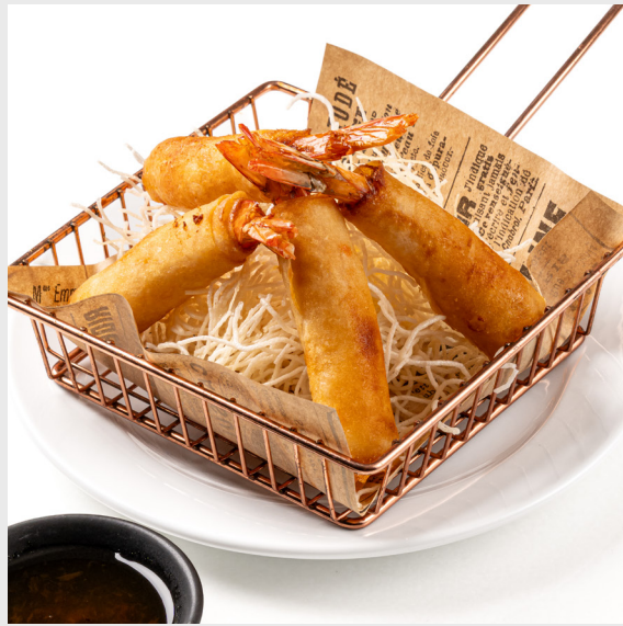
ปอเปี๊ยะกุ้งทอด SHRIMP SPRING ROLLS (4 PCS.)