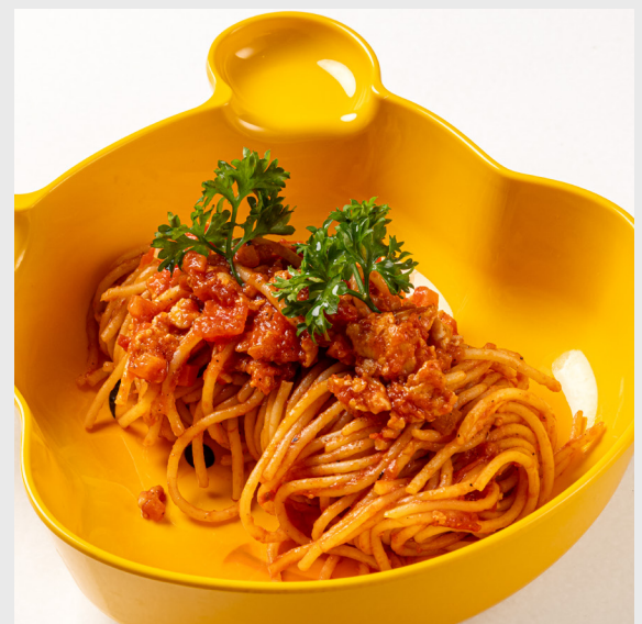
สปาเก็ตตี้โบโลเนสไก่/หมู/เนื้อ SPAGHETTI BOLOGNESE Chicken/Pork/Beef