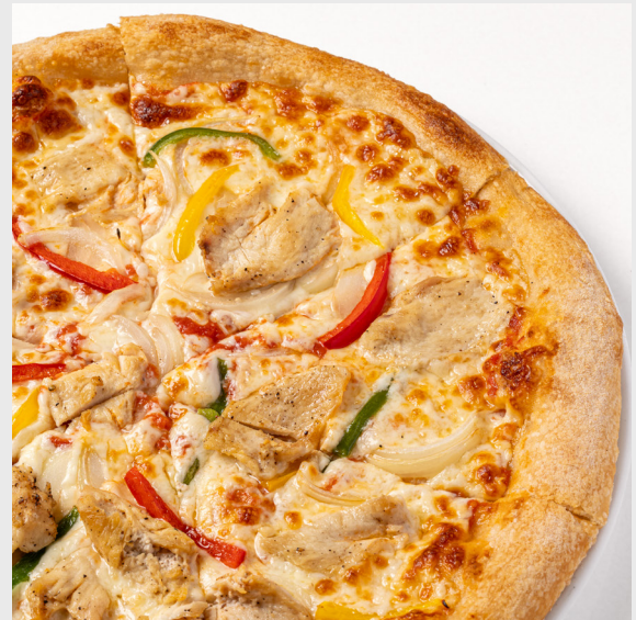
ชิกเก้นสุพรีม CHICKEN SUPREME