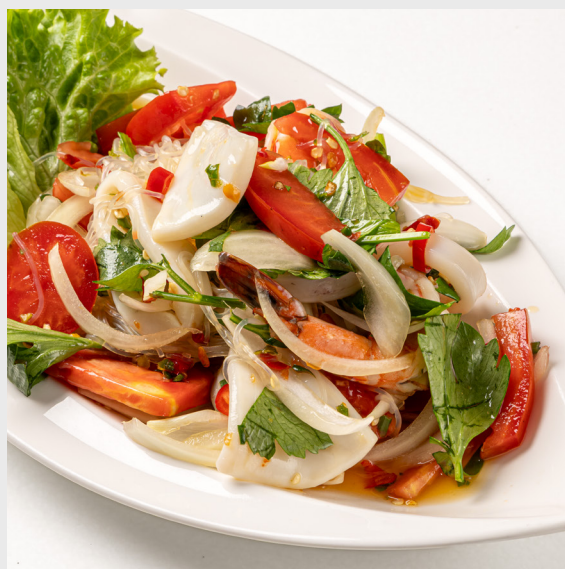
ยำวุ้นเส้นไก่/หมู/ทะเล SPICY VERMICELLI SALAD 🌶️ Chicken/Pork/Seafood