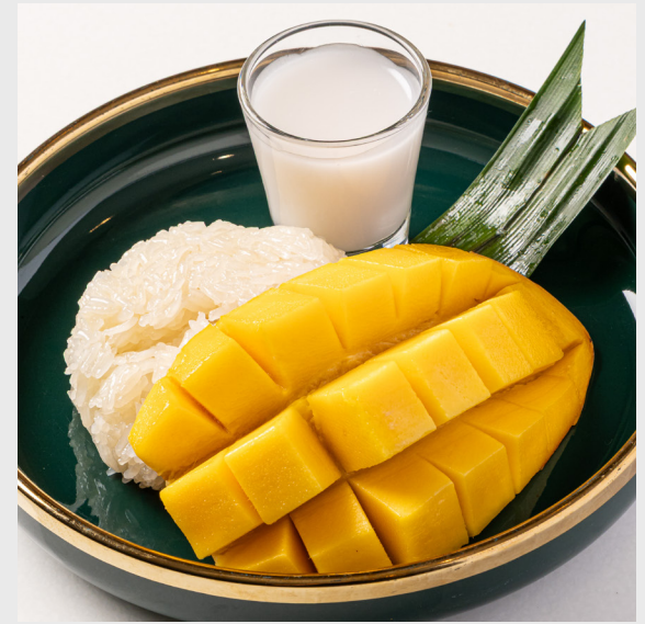
ข้าวเหนียวมะม่วง MANGO STICKY RICE