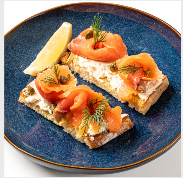
บรูสเกตต้าแซลมอนรมควัน SMOKED SALMON CREAM CHEESE BRUSCHETTA