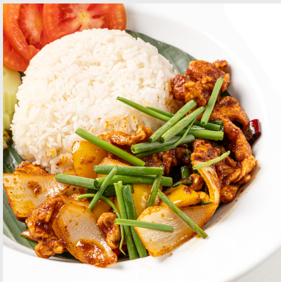
ไก่ผัดเม็ดมะม่วงหาวขาว STIR-FRIED CHICKEN WITH CASHEW NUTS 🌶️