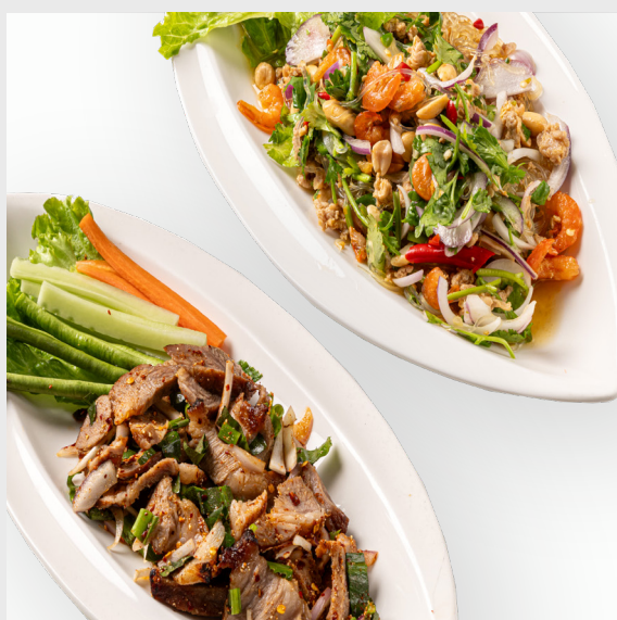
ยำวุ้นเส้นโบราณ VERMICELLI SPICY SALAD WITH MINCED PORK 🌶️ 🐷