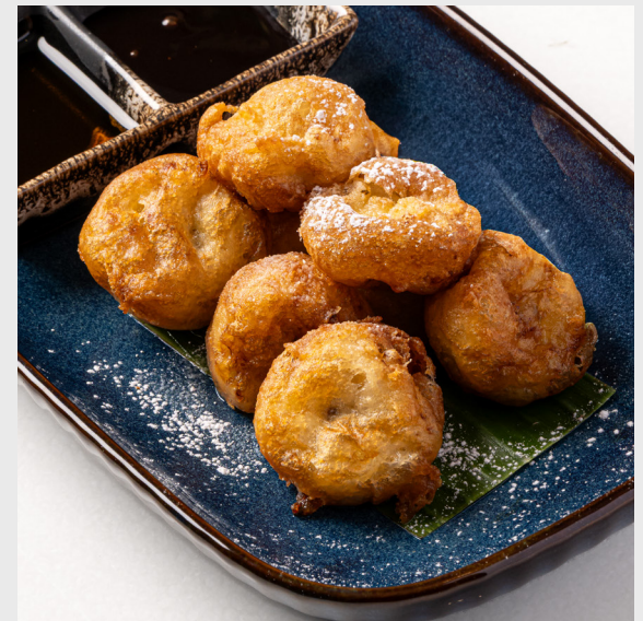
กล้วยทอด BANANA FRITTER