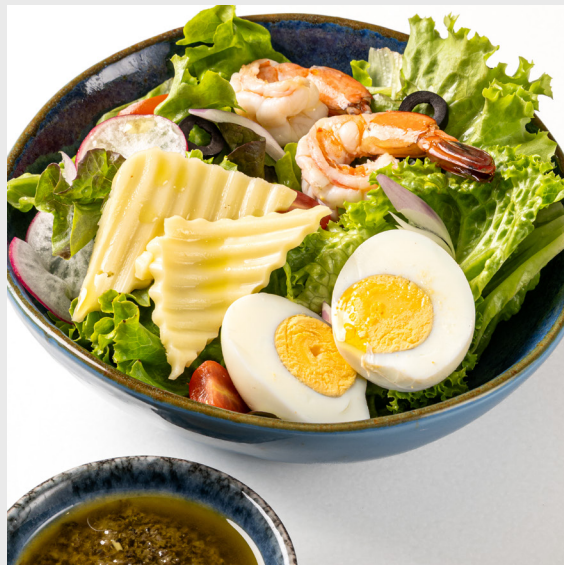
สลัดกุ้ง SHRIMP SALAD