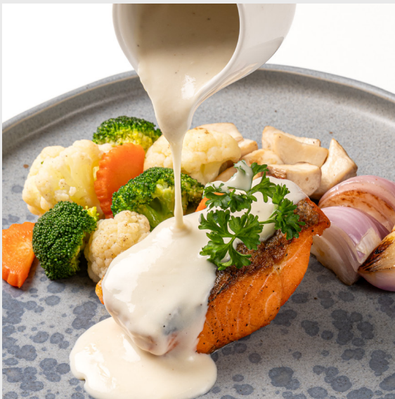
แซลมอนพาว์กับซอสบูร์เร่ลานค์ SALMON PAVÉ & BEURRE BLANC SAUCE