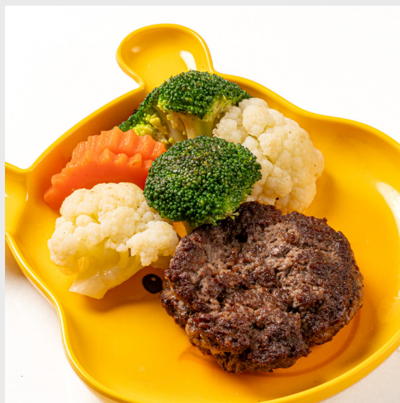
แฮมเบอร์เกอร์เนื้อ BEEF HAMBURG PATTY