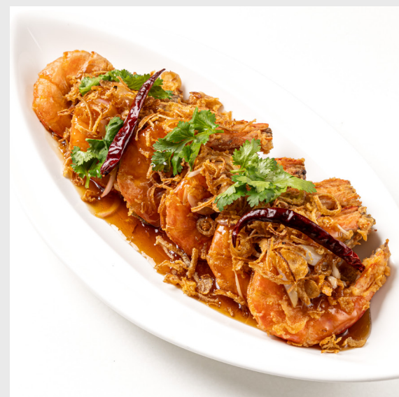
กุ้งผัดซอสมะขาม FRIED SHRIMP WITH TAMARIND SAUCE