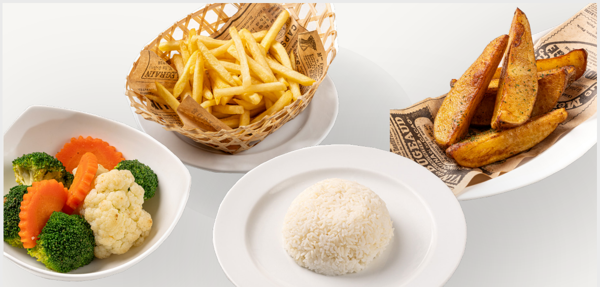
• เฟรนช์ฟรายส์ BASKET OF FRENCH FRIES