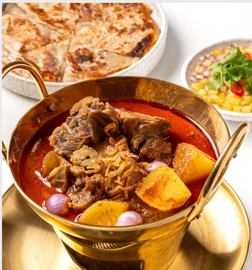
ภาคกลาง (แกงมัสมั่นเนื้อ และโรตีส) CENTRAL Massaman beef curry