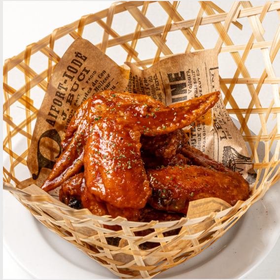
ปีกไก่ซอสบาร์บีคิว BBQ CRISPY CHICKEN WINGS