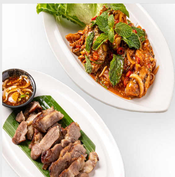
ยำปลากระป๋อง SPICY CANNED FISH SALAD 🌶️