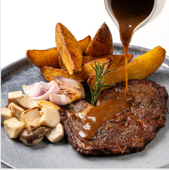
สเต็กเนื้อริบอาย RIBEYE STEAK