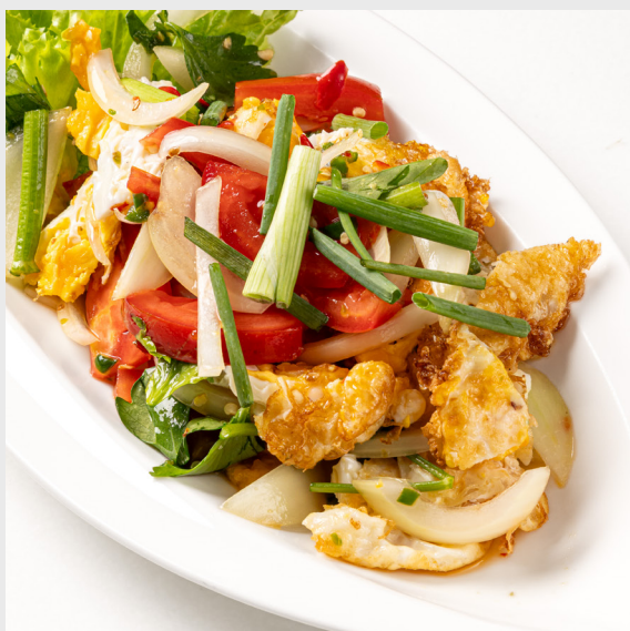
ยำไข่ดาว SPICY FRIED EGG SALAD 🌶️