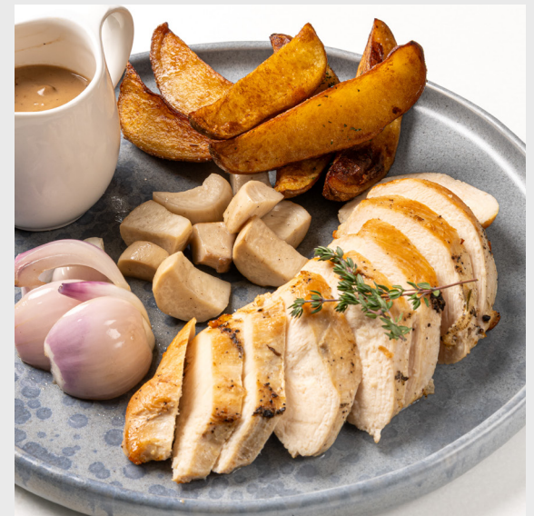
สเต็กอกไก่ CHICKEN BREAST