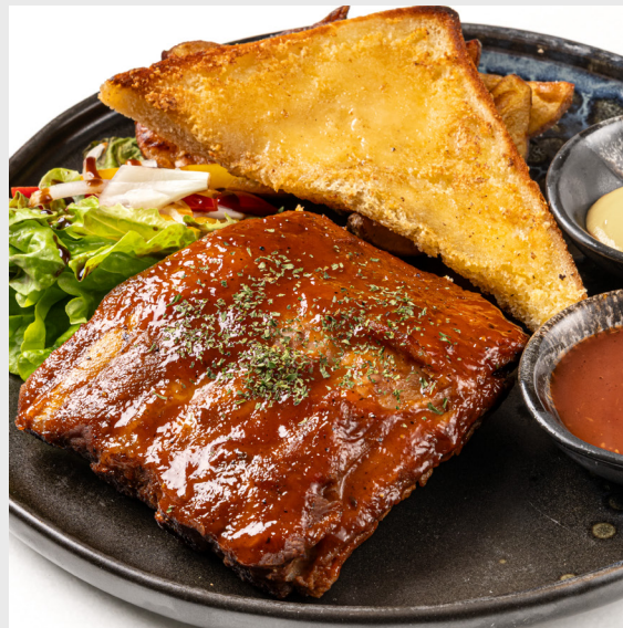
ซี่โครงอบรมควันซอสบาร์บีคิว SMOKED BBQ PORK SPARE RIBS 🐷