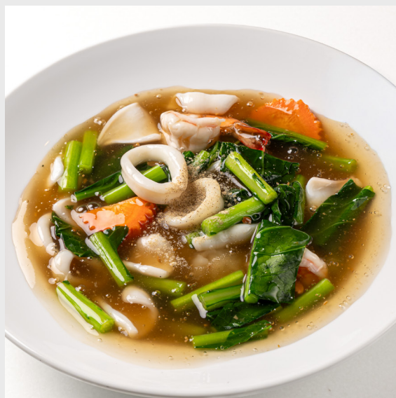
ราดหน้าไก่/หมู/ทะเล LAD-NA RICE NOODLES IN GRAVY SAUCE Chicken/Pork/Seafood