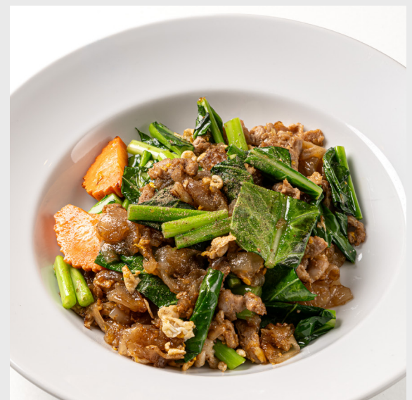
ผัดซีอิ๊วไก่/หมู/ทะเล PAD-CE-IEW FRIED NOODLES WITH SOY SAUCE Chicken/Pork/Seafood