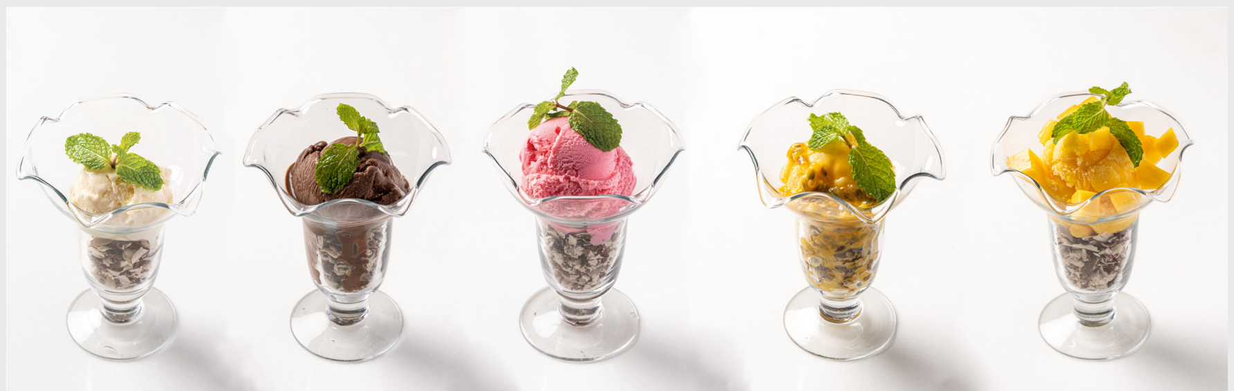
ไอศกรีม : วานิลลา/ ช็อคโกแลต/ สตรอว์เบอร์รี่ ICE CREAM : VANILLA/ CHOCOLATE/ STRAWBERRY