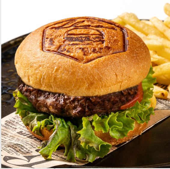
เบอร์เกอร์เนื้อวากิว FLAVA WAGYU BEEF BURGER