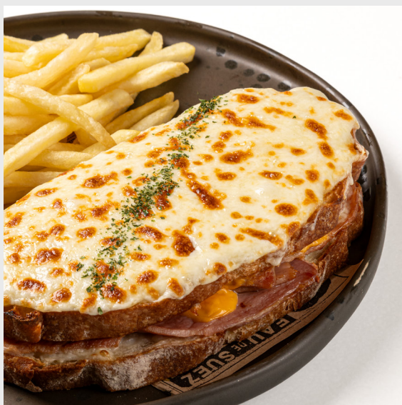
คร็อกมองสิ เออร์ CROQUE MONSIEUR 🐷