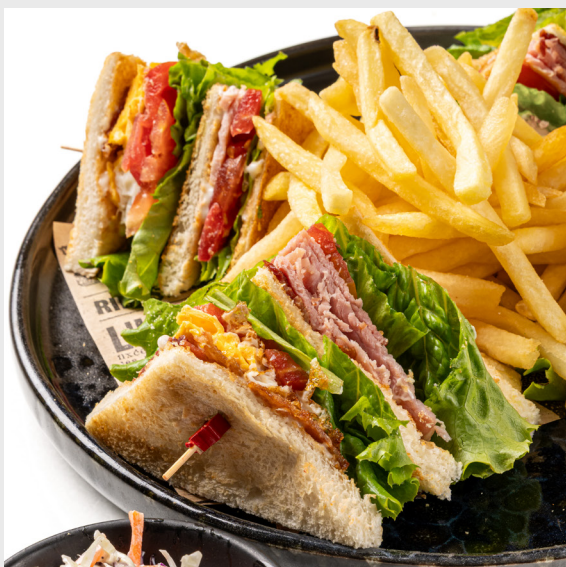
คลับแซนด์วิช CLUB SANDWICH 🐷