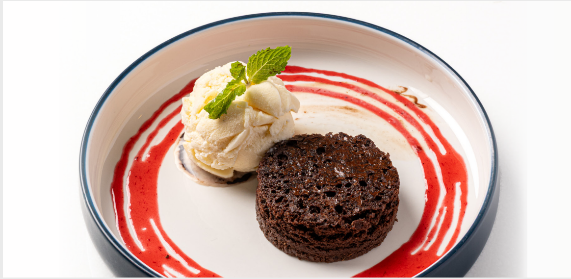
เค้กदारกช็อคโกแลตเสิร์ฟแบบอุ่น HOMEMADE WARM DARK CHOCOLATE CAKE