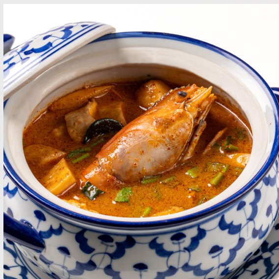
ต้มยำกุ้ง TOM-YUM SHRIMP 🌶️