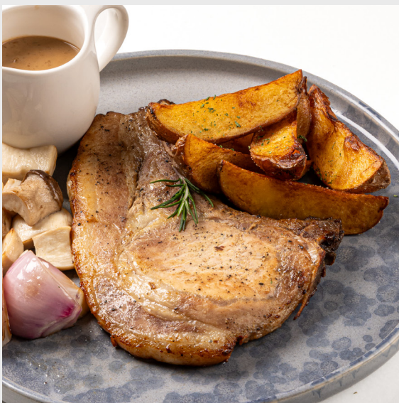
พอร์คชอป PORK CHOP 🐷