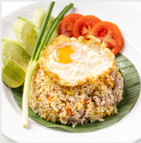
ข้าวผัดไก่/หมู/เนื้อ/ทะเล FRIED RICE Chicken/Pork/Beef/Seafood