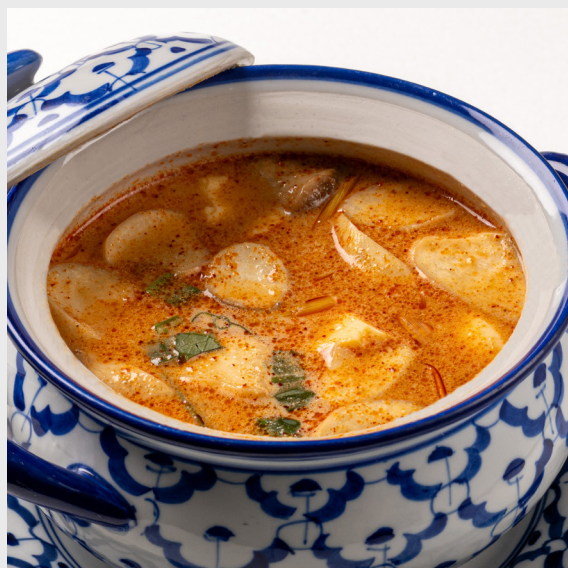
ต้มยำไข่ตุ๋น TOM-YUM STEAMED EGG 🌶️