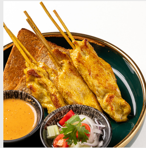
ไก่เสฉี่ GRILLED CHICKEN SATAY (6 PCS.) (Contains nuts)