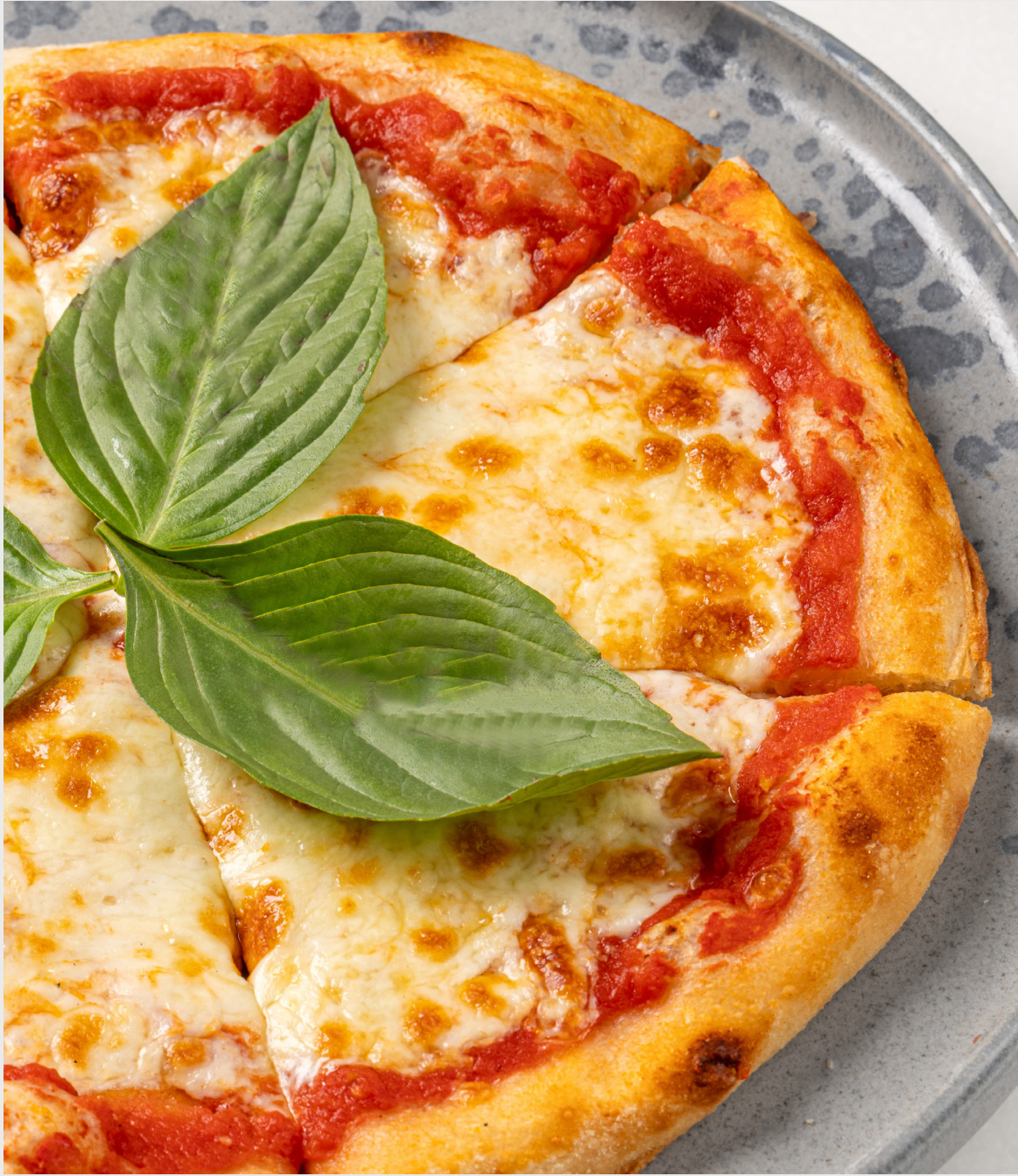
มินิ มาร์การิตาพิซซ่า MINI MARGHERITA PIZZA