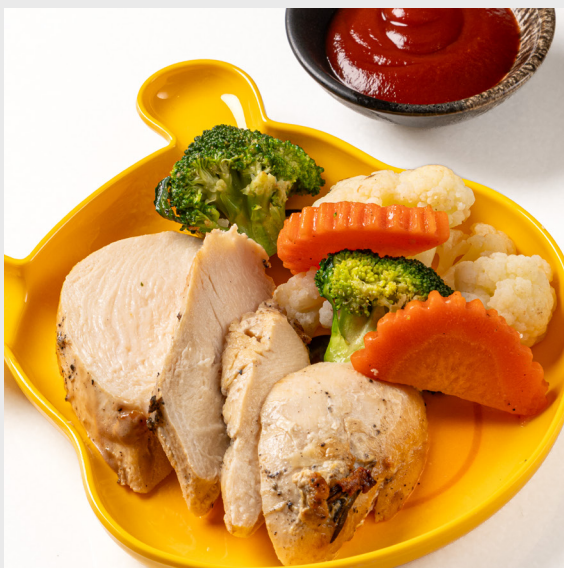
อกไก่ CHICKEN BREAST