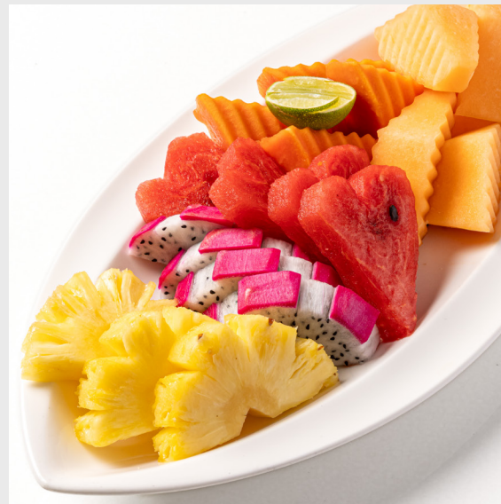
ผลไม้รวม FRUIT PLATTER