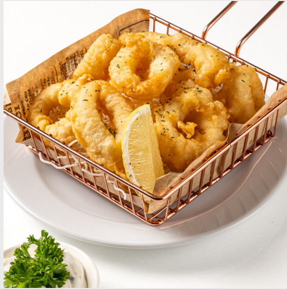
คาลามารี - ปลาหมึกชุบแป้งทอด CRISPY CALAMARI