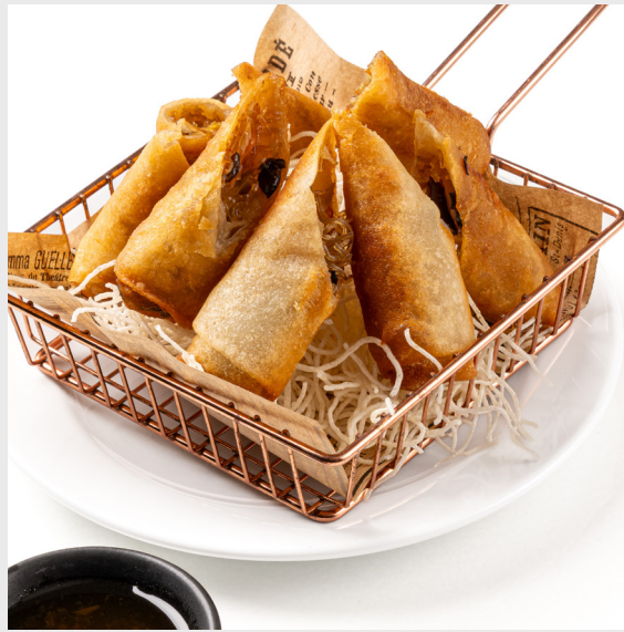
ปอเปี๊ยะผักทอด VEGGIES SPRING ROLLS (4 PCS.)