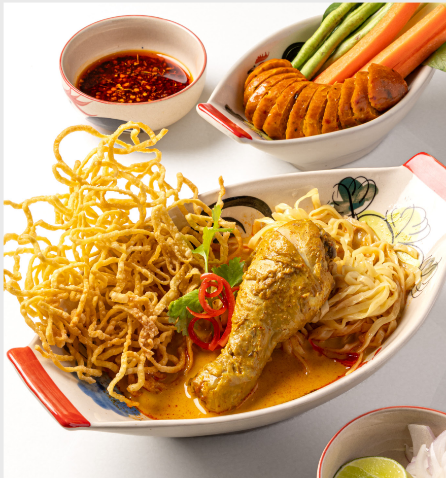
ภาคเหนือ (ข้าวซอยไก่ และไส้อั่วหมู) NORTHERN Khao Soi chicken & Northern Thai sausage