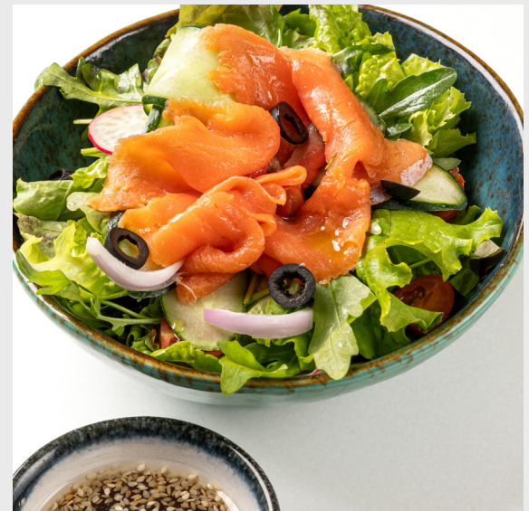
สลัดปลาแซลมอนรมควัน SMOKED SALMON SALAD