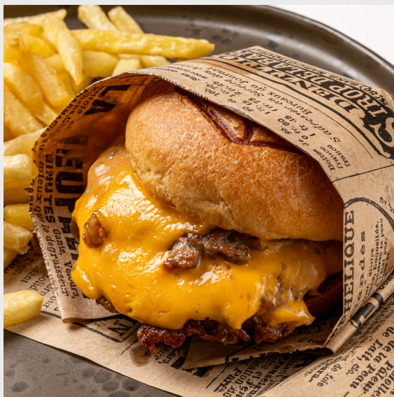
สแมชชีสเบอร์เกอร์หมู SMASH PORK CHEESEBURGER 🐷