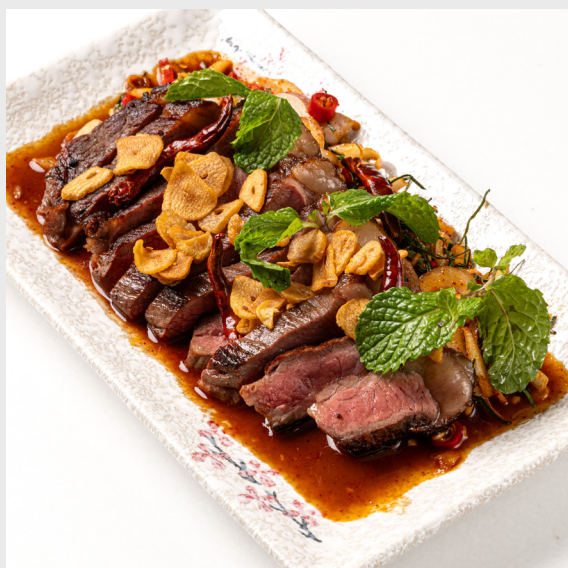
ปล่าเนื้อพิกานย่า GRILLED PICANHA BEEF SPICY SAUCE 🌶️