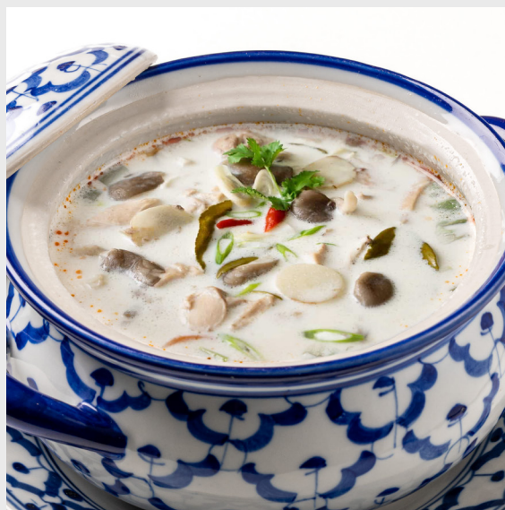
ต้มข่าไก่ TOM-KHA COCONUT CHICKEN 🌶️