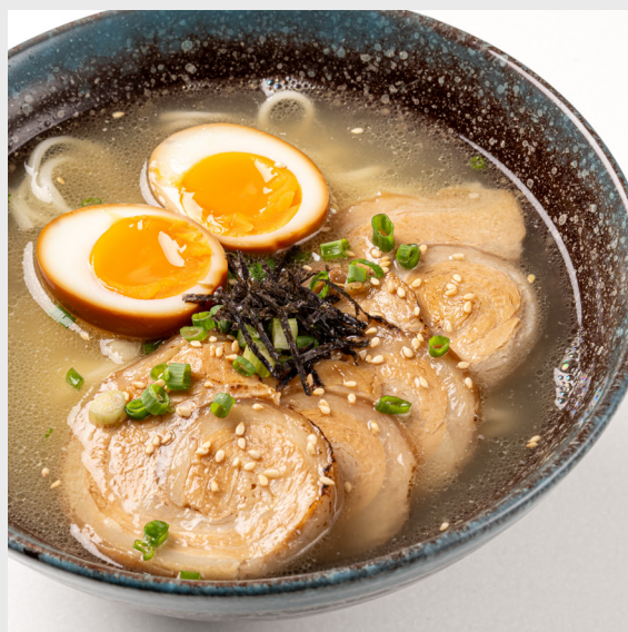
ทงคตส์ราเมน TONKATSU RAMEN PORK BELLY NOODLE (JAPANESE) 🐷