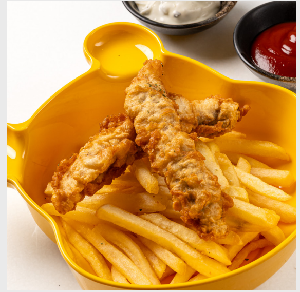
ฟิชแอนด์ชิปส์ FISH & CHIPS