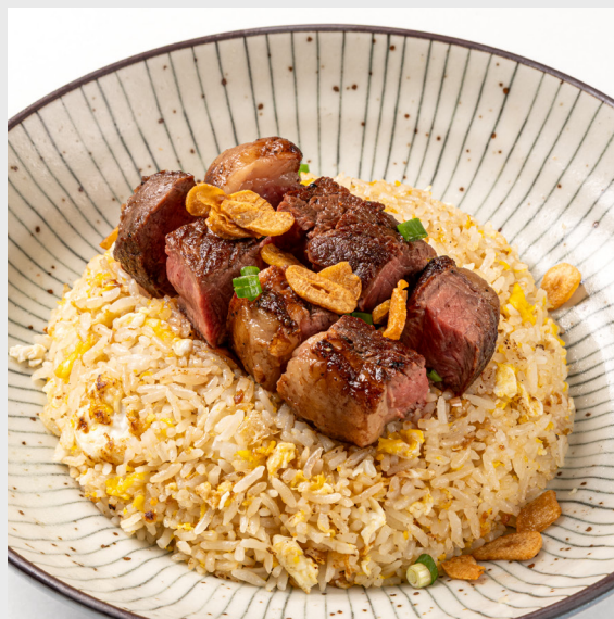
ข้าวผัดกระเทียมเนื้อพิกานย่า GARLIC FRIED RICE TOPPED PICANHA BEEF