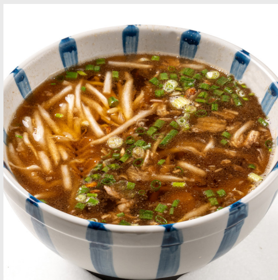
ต้มหมูตุ๋น BRAISED PORK SOUP 🐷