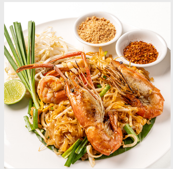
ผัดไทยไก่/กุ้ง TRADITIONAL PAD THAI RICE NOODLES Chicken/Shrimp (Contains nuts)