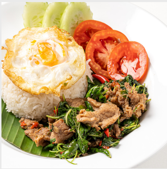
ผัดกะเพราราดข้าวไก่/หมู/เนื้อ/ทะเล STIR-FRIED HOLY BASIL 🌶️ Chicken/Pork/Beef/Seafood