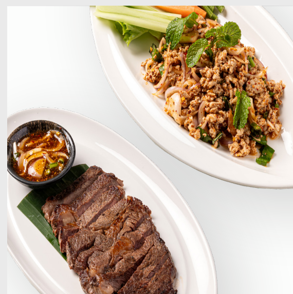
ลาบหมู SPICY MINCED PORK SALAD 🌶️ 🐷