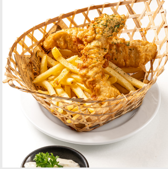
ฟิชแอนด์ชิปส์ FISH & CHIPS