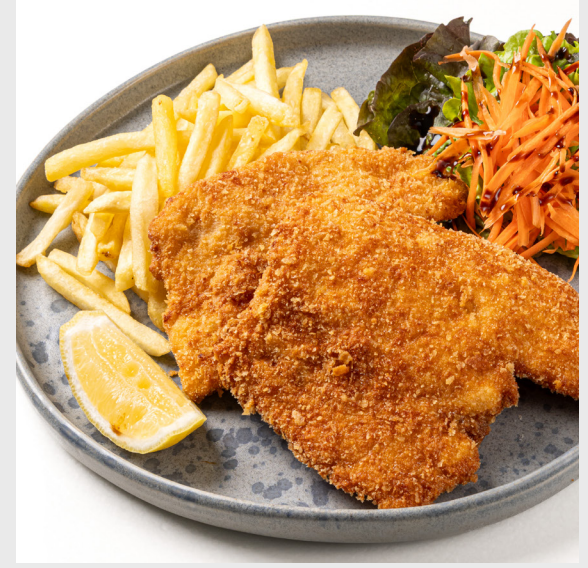
อกไก่ชุบเกล็ดขนมปังทอด CRISPY BREADED THIN CHICKEN CUTLETS