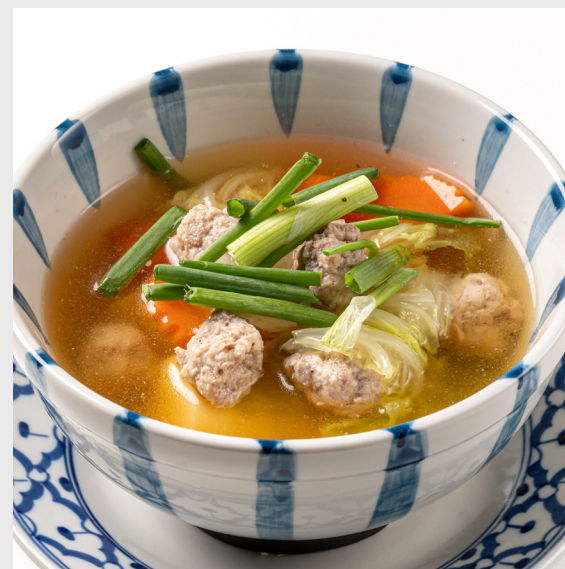
แกงจืดเต้าหู้หมูสับ CLEAR SOUP WITH TOFU & MINCED PORK 🐷