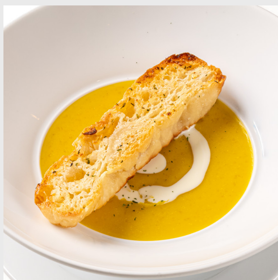
ซูปฟักทอง PUMPKIN CREAM 🌿