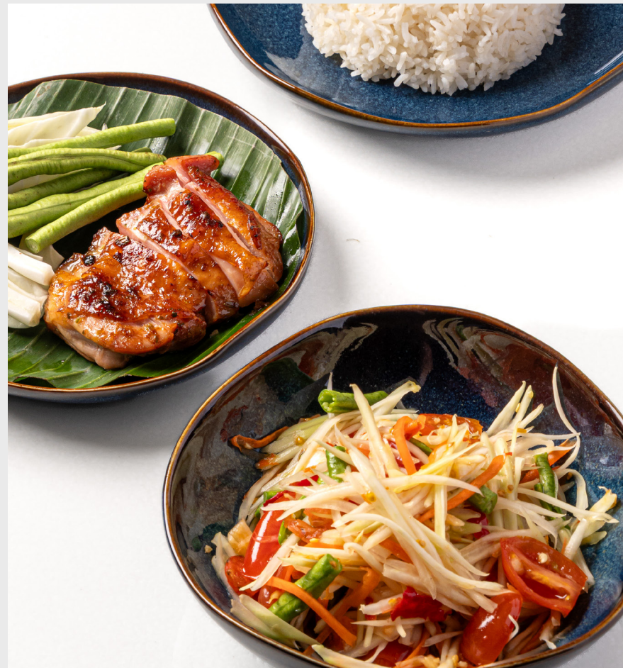
ภาคอีสาน (ส้มตำ และไก่ย่าง) NORTH EASTERN Som Tam papaya salad & grilled chicken