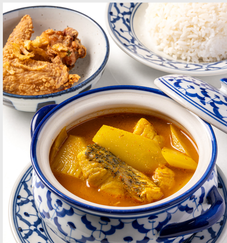
ภาคใต้ (แกงเหลืองปลากะพง และปีกไก่ทอด) SOUTHERN Southern Thai spicy seabass yellow curry & fried chicken