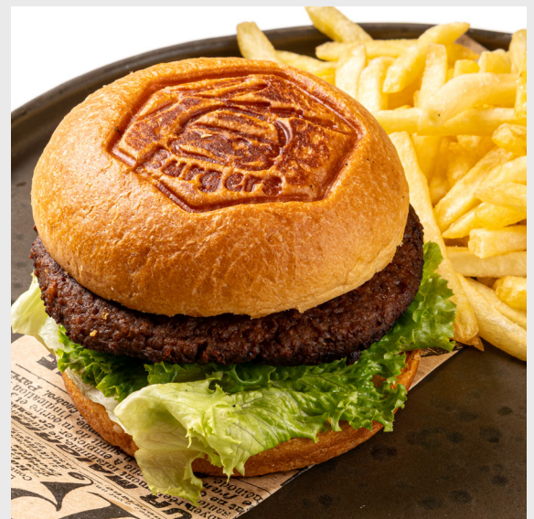
เบอร์เกอร์แพลนต์เบส PLANT-BASED BURGER 🌿