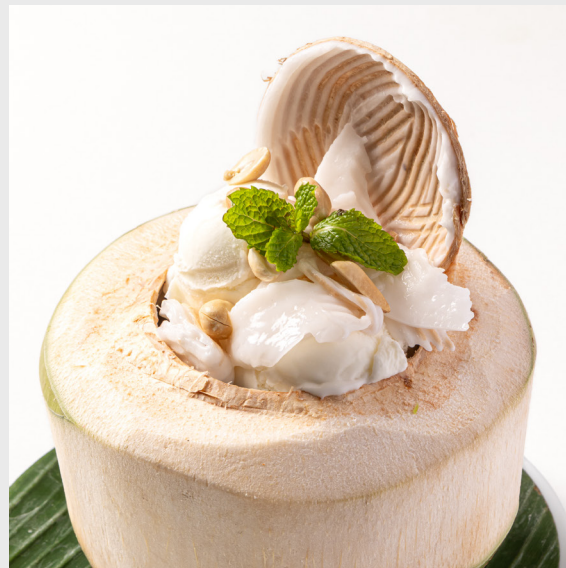
ไอศกรีมกะทิ COCONUT ICE CREAM