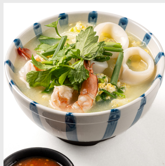
สุกีน้าไก่/หมู/เนื้อ/ทะเล THAI STYLE SUKIYAKI Chicken/Pork/Beef/Seafood 200/230/260/290